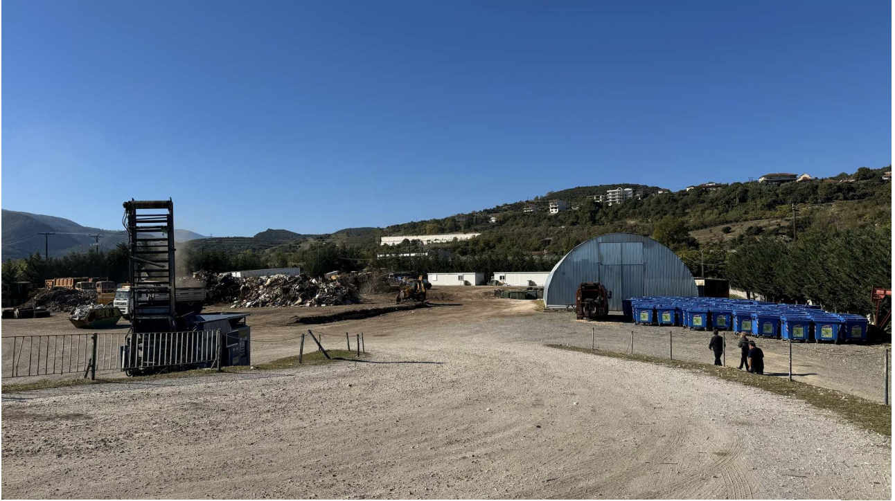
Εικόνα 1: Ευρύτερος αδειοδοτημένος χώρος (αγροτ. 176νστ) στάθμευσης απορριμματοφόρων οχημάτων και ΣΜΑ Δ.Βέροιας (Βορειο-Δυτική όψη).

Επίσης, λήφθηκε φωτογραφικό υλικό το οποίο παρουσιάζεται παρακάτω.