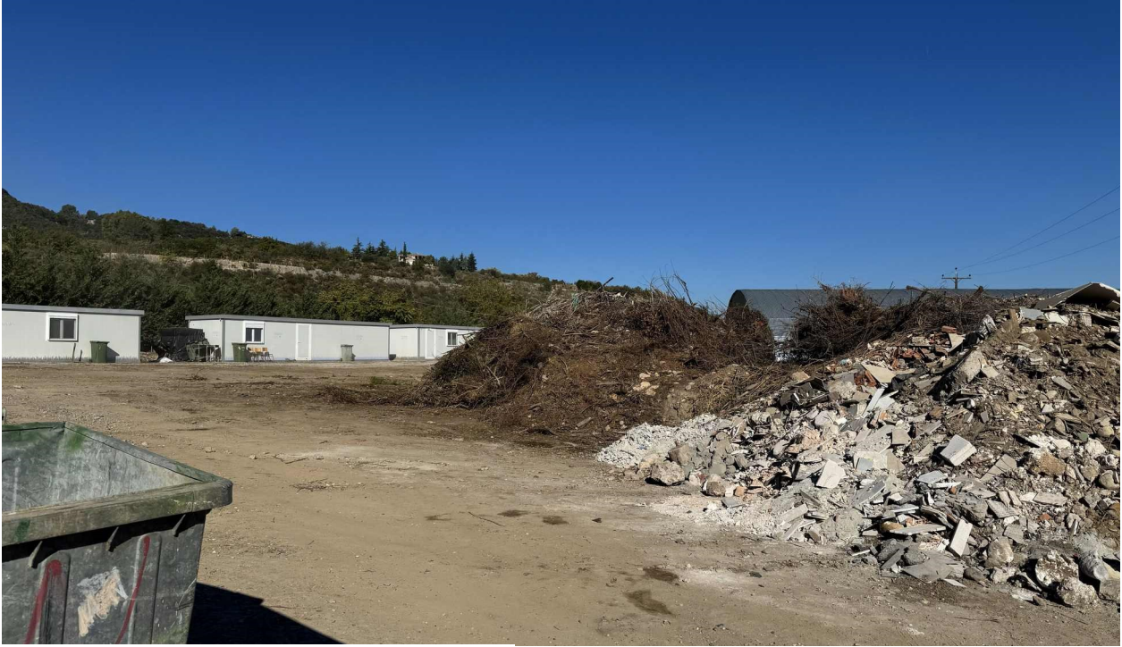
Εικόνα 3: Σωροί εναπόθεσης κλαδεμάτων και ΑΕΚΚ