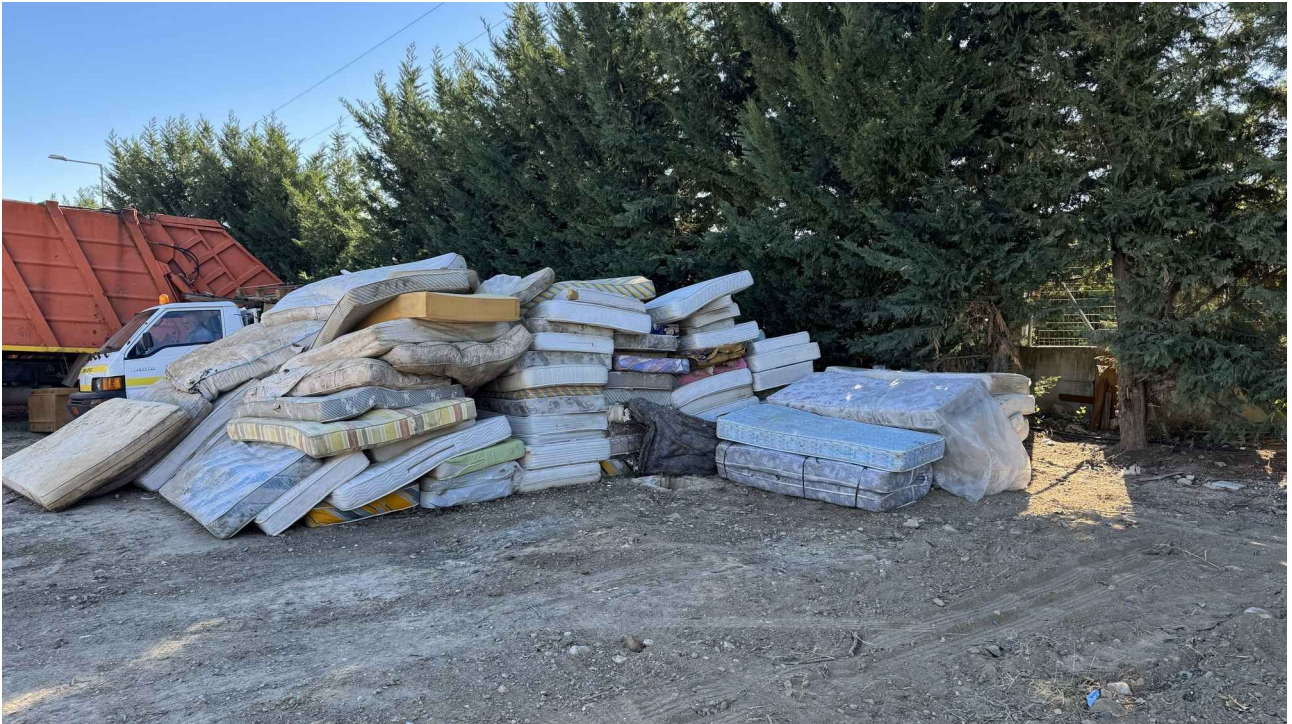
Εικόνα 4: Περιοχή συλλεγμένων στρωμάτων