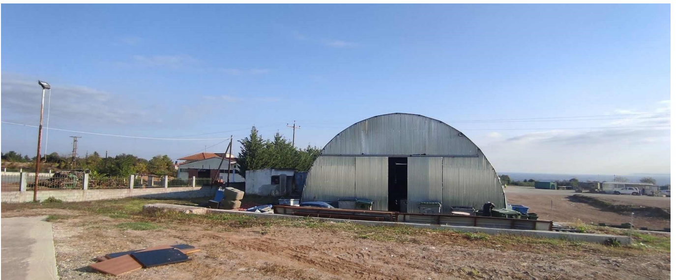
Εικόνα 9: Βορειο-Ανατολική όψη του αδειοδοτημένου χώρου