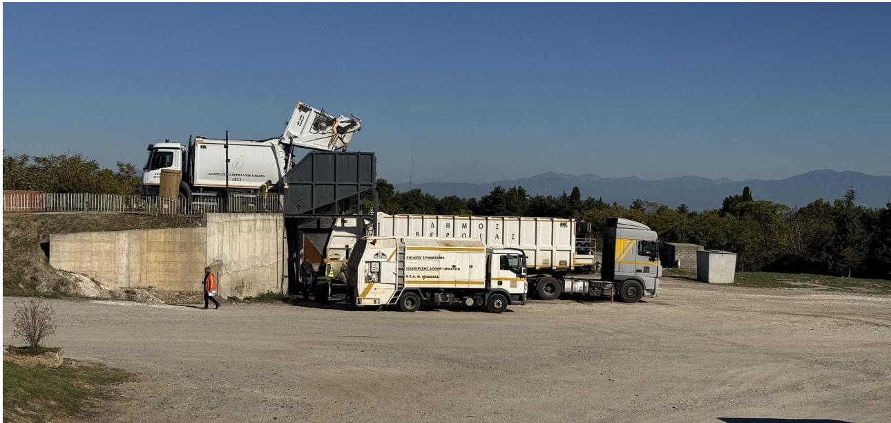
Εικόνα 5: Περιοχή μεταφόρτωσης απορριμμάτων ΑΣΑ