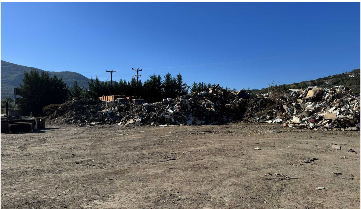
Εικόνα 2: Περιοχή εντός του αδειοδοτημένου χώρου όπου έγινε εναπόθεση στερεών αποβλήτων