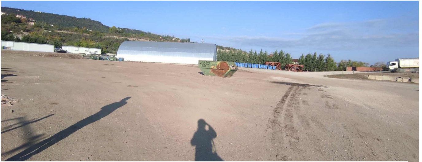
Εικόνα 7: Αδειοδοτημένος Χώρος (αγροτ. 176νστ) απορριμματοφόρων οχημάτων & ΣΜΑ Δ. Βέροιας μετά την απομάκρυνση των εναποτιθέμενων σωρών στερεών αποβλήτων.

Επίσης, λήφθηκε φωτογραφικό υλικό το οποίο παρουσιάζεται παρακάτω.