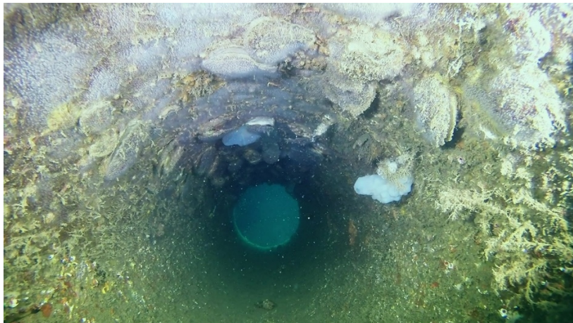
Εικόνα 5. Εποικισμός των τεχνητών στοιχείων στο τέλος της τριετούς Επιστημονικής «ΚΑΤΑΣΚΕΥΗ ΤΕΧΝΗΤΟΥ ΥΦΑΛΟΥ ΣΤΗΝ ΠΕΡΙΟΧΗ ΚΙΤΡΟΥΣ Ν. ΠΙΕΡΙΑΣ» (ΑΔΑ 6ΣΩΠ4653ΠΓ-1Ν2) με Κωδικό ΟΠΣ 5009807