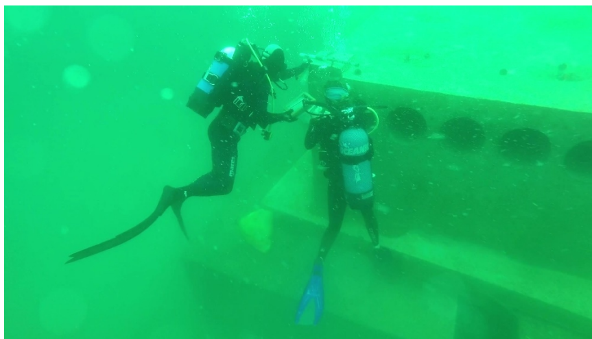
Εικόνα 2. Υποβρύχια παρακολούθηση στα τεχνητά στοιχεία τύπου Α