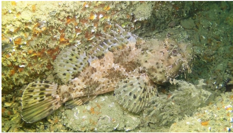
Εικόνα 3. Ιχθυοπανίδα του Τ.Υ.