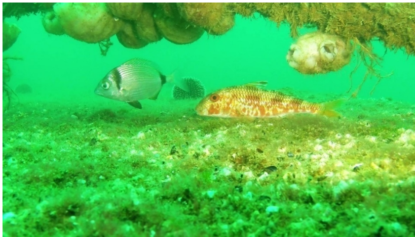
Εικόνα 4 Εποικισμός των στοιχείων δύο χρόνια μετά την πόντιση