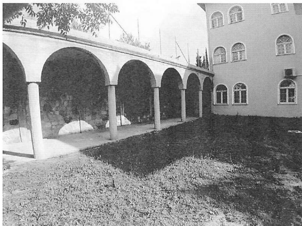
Φωτογραφία 2: Θέση κατασκευής σκάλας