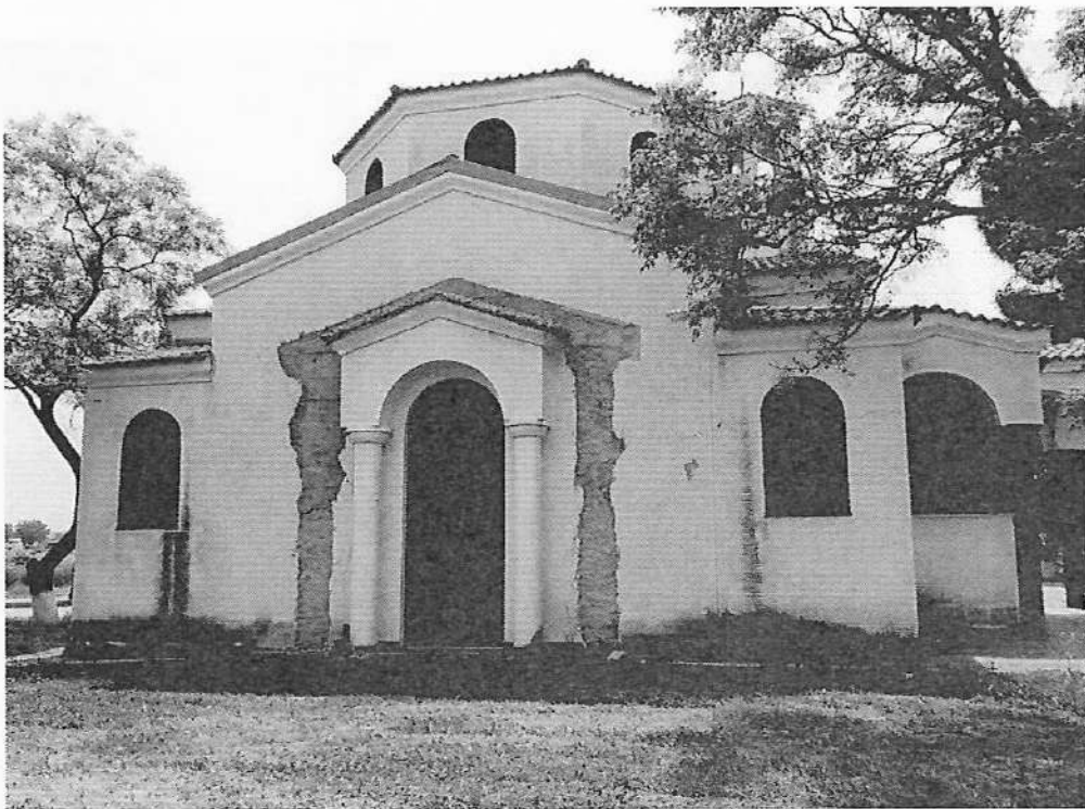
Φωτογραφία 4: Ι.Ν. Αγίας Σοφίας όπου θα κατασκευαστεί περιμετρική αποστράγγιση