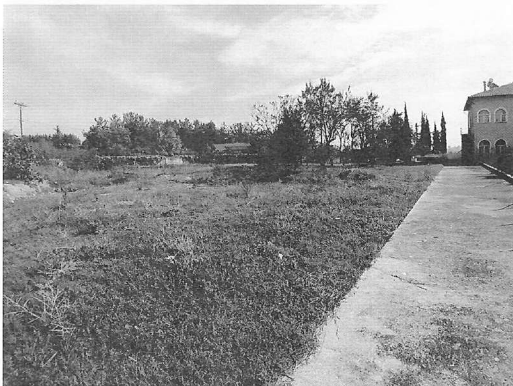
Φωτογραφία 1: Θέση κατασκευής γηπέδων μπάσκετ & ποδοσφαίρου