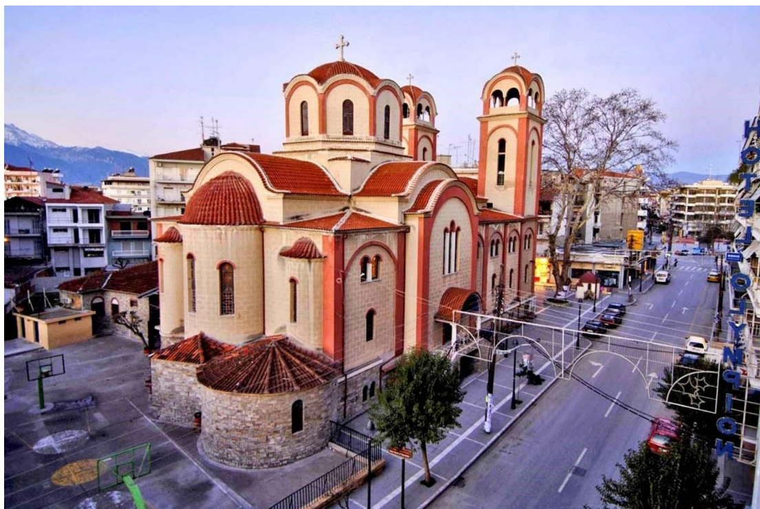
Αεροφωτογραφία του Ιερού Ναού

Τα ανοίγματα του Ιερού Ναού αναπτύσσονται σε δύο ζώνες καθώς και σε ενδιάμεσο επίπεδο στον χώρο του Ιερού του Ναού. Διακρίνονται χαμηλά ή ψηλότερα ανοίγματα, μονά ή διπλά με διαχωριστικό από μάρμαρο, λεπτής ορθογωνικής διατομής με ημικυκλική τοξοειδή απόληψη. Στην κεντρική πρόσοψη του Ναού διακρίνεται τριπλό άνοιγμα με χωρίσματα μαρμάρου. Όλα τα ανοίγματα διαθέτουν αξιοσημείωτα βιτρό τα οποία επίσης αποτελούν σημεία ανάδειξης.