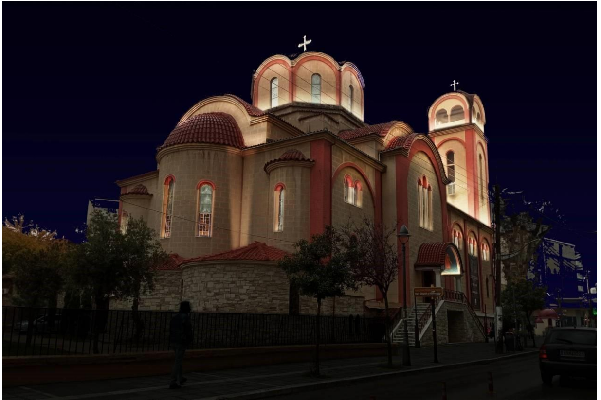
Αποψη της όψης του Ιερού, του τρούλου, και της ανατολικής όψης με το αντίστοιχο κωδωνοστάσιο (Κωδωνοστάσιο 1) στο νυχτερινό τοπίο