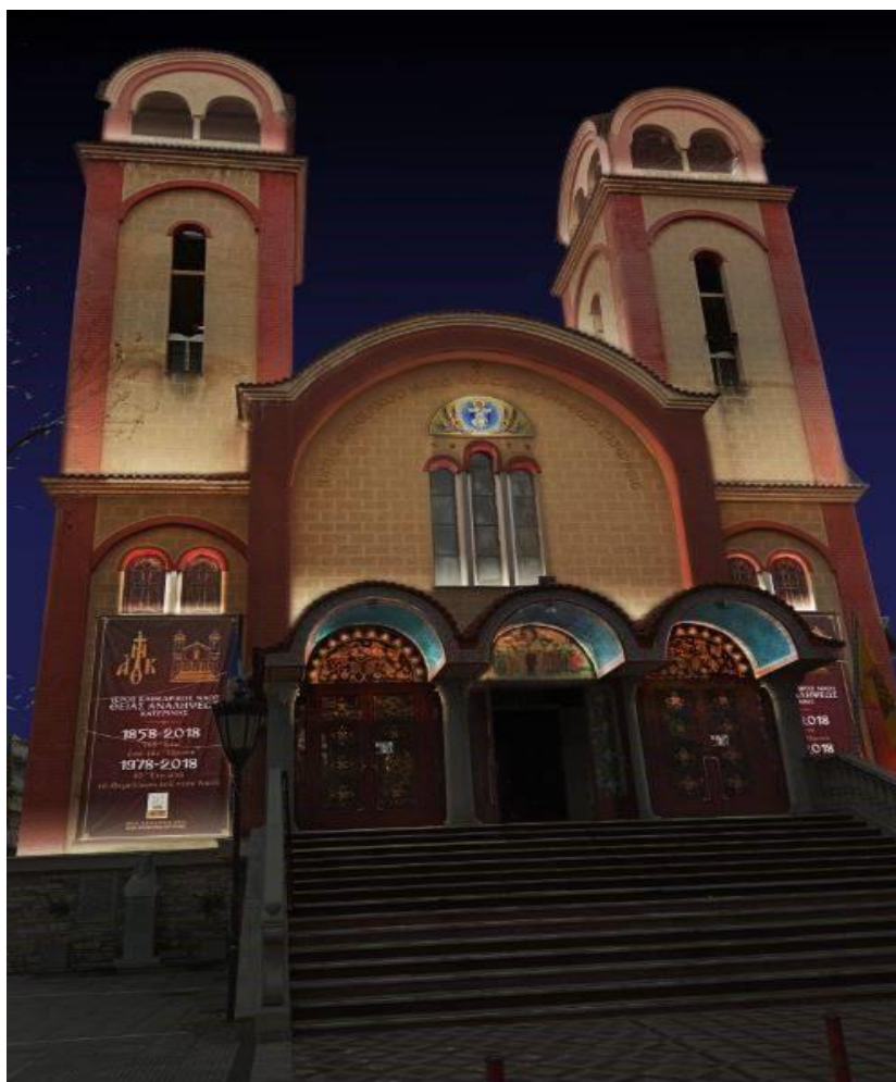
Άποψη της πρόσοψης του Ιερού Ναού στο νυχτερινό τοπίο

Η εικονική απόδοση φωτισμού του Ιερού Ναού στο νυχτερινό τοπίο παρουσιάζεται στις δύο παρακάτω εικόνες. Πραγματοποιήθηκε προκειμένου να επιλεγεί ο επιθυμητός ανάδεικτικός φωτισμός του Ιερού Ναού.