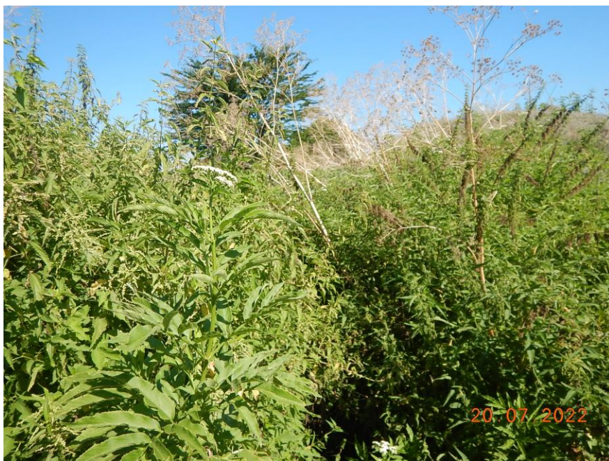
Σημείο Β οικισμού Γαζώρου