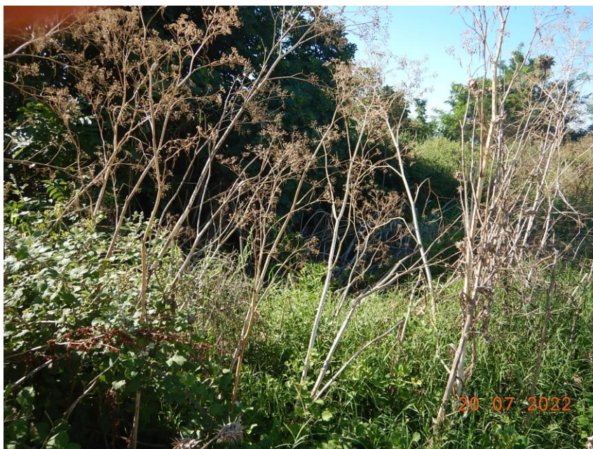
Σημείο Α οικισμού Γαζώρου