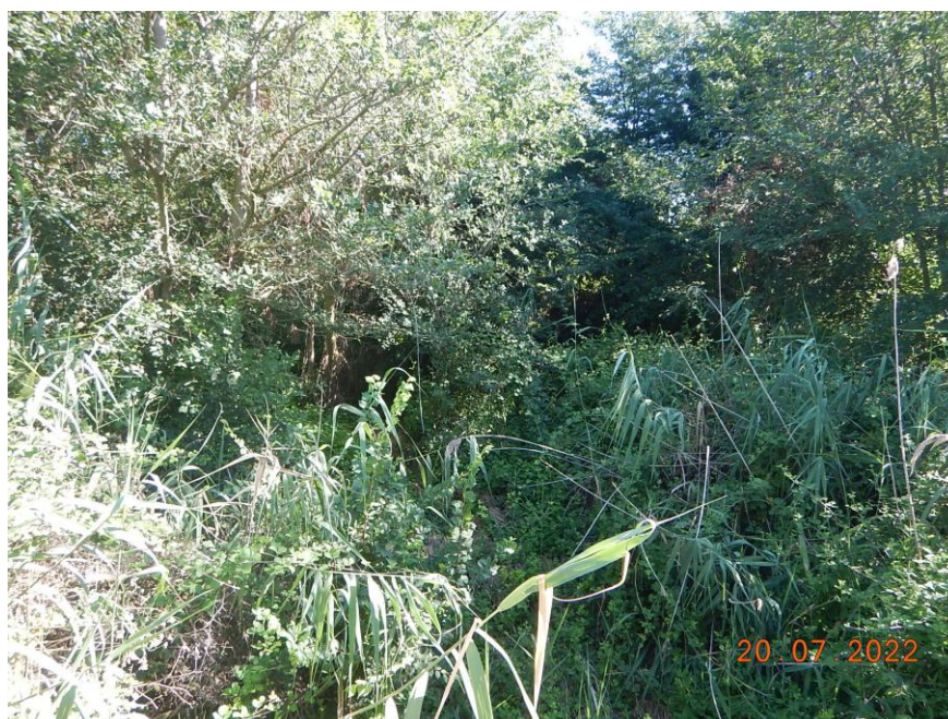
Σημείο Γ οικισμού Νέας Πέτρας

Τα ανωτέρω γνωστοποιήθηκαν στον Δήμο Νέας Ζίχνης με το (20) σχετικό έγγραφο, προκειμένου να υποβάλλει γραπτώς τις απόψεις – αντιρρήσεις επί της (19) σχετικής έκθεσης περιβαλλοντικής επιθεωρήσεως (προσωρινή έκθεση ελέγχου) του κλιμακίου του Τμήματος Περιβάλλοντος και Υδροοικονομίας της Δ/σης Ανάπτυξης και Περιβάλλοντος της ΠΕ Σερρών.