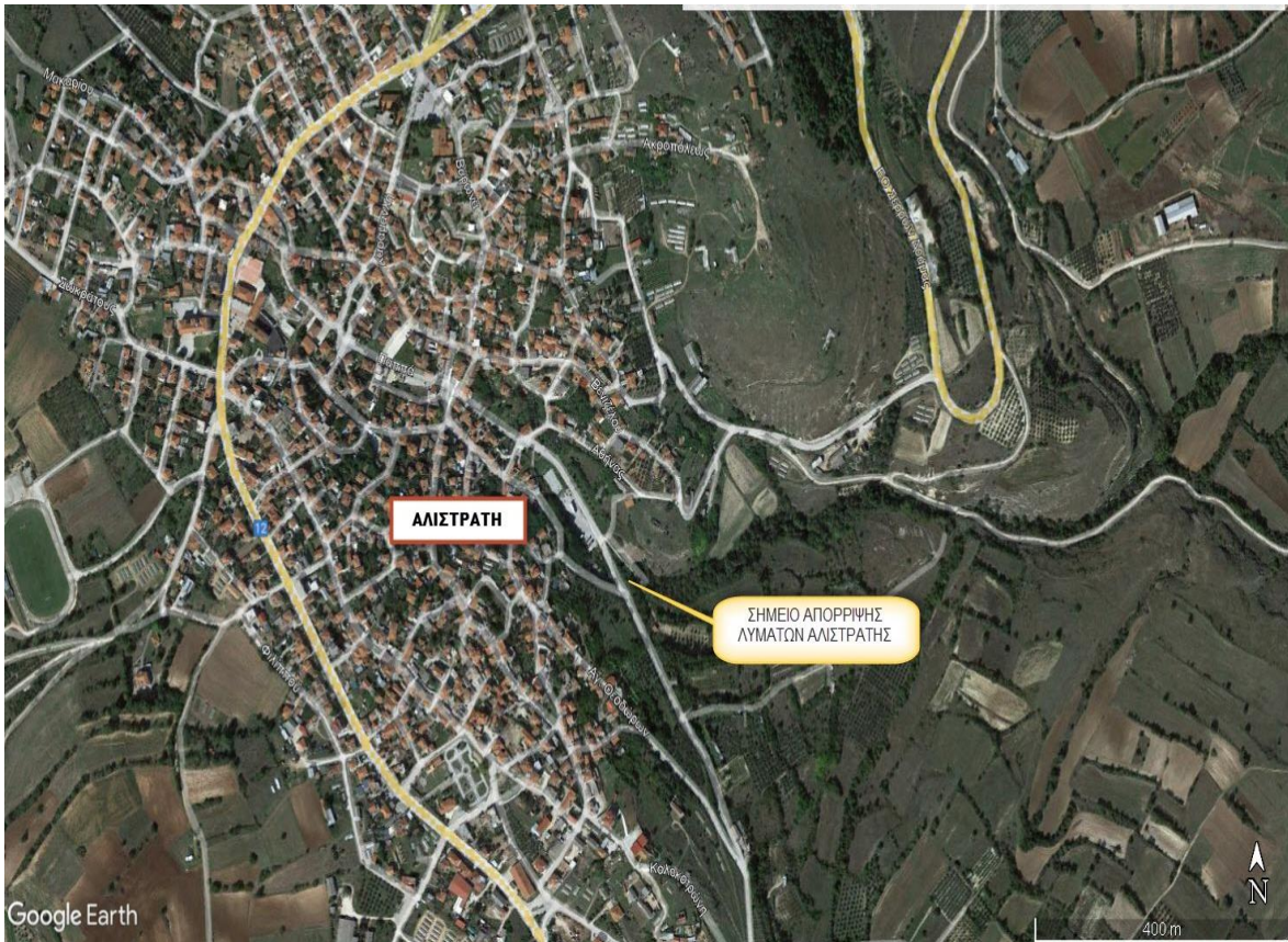
Φωτογραφική τεκμηρίωση της από 21-10-2022 αυτοψίας