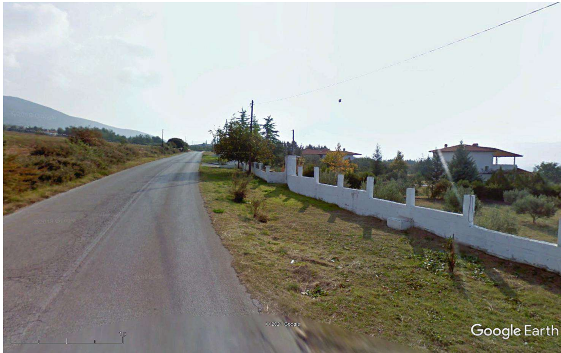
Φωτ.3 Υφιστάμενη κατάσταση κατά μήκος του οδικού τμήματος της δυτικής εισόδου του οικισμού της Γαλάτιστας από την Ε.Ο. Θεσσαλονίκης – Πολυγύρου. Είναι εμφανής η απουσία οδοφωτισμού με τη συνακόλουθη πρόκληση αρκετών προβλημάτων κατά την κίνηση πεζών και οχημάτων. Σε όλο το μήκος της οδού και εκατέρωθεν αυτής προβλέπεται η αισθητική βελτίωσή της με φύτευση θάμνων και δενδρυλλίων με κατάλληλο σύστημα άρδευσης.