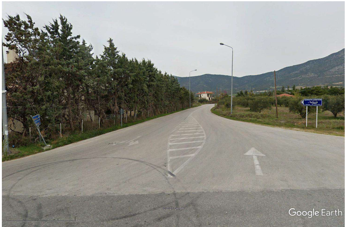
Φωτ.1 Υφιστάμενος ισόπεδος κόμβος στη δυτική είσοδο του οικισμού της Γαλάτιστας από την Ε.Ο. Θεσσαλονίκης – Πολυγύρου (αρχή έργου).