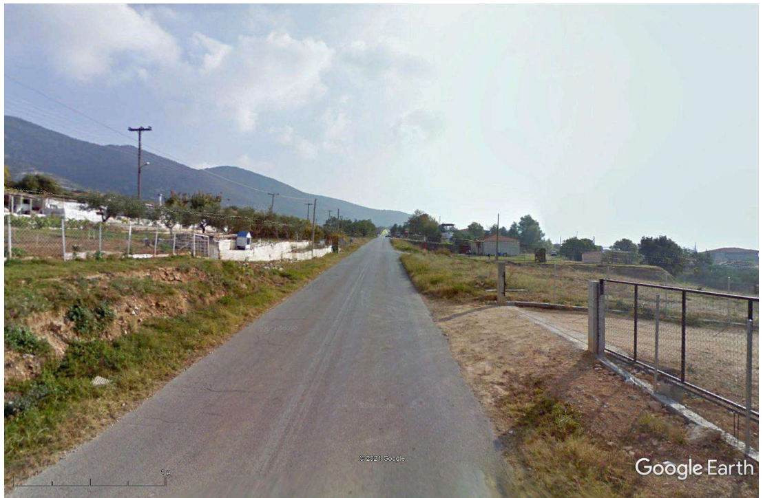
Φωτ.4 Υφιστάμενη κατάσταση κατά μήκος του οδικού τμήματος της δυτικής εισόδου του οικισμού της Γαλάτιστας από την Ε.Ο. Θεσ/κης–Πολυγύρου. Είναι εμφανής η απουσία οδοφωτισμού με τη συνακόλουθη πρόκληση αρκετών προβλημάτων κατά την κίνηση πεζών και οχημάτων. Σε όλο το μήκος της οδού και εκατέρωθεν αυτής προβλέπεται η αισθητική βελτίωσή της με φύτευση θάμνων και δενδρυλλίων με κατάλληλο σύστημα άρδευσης.