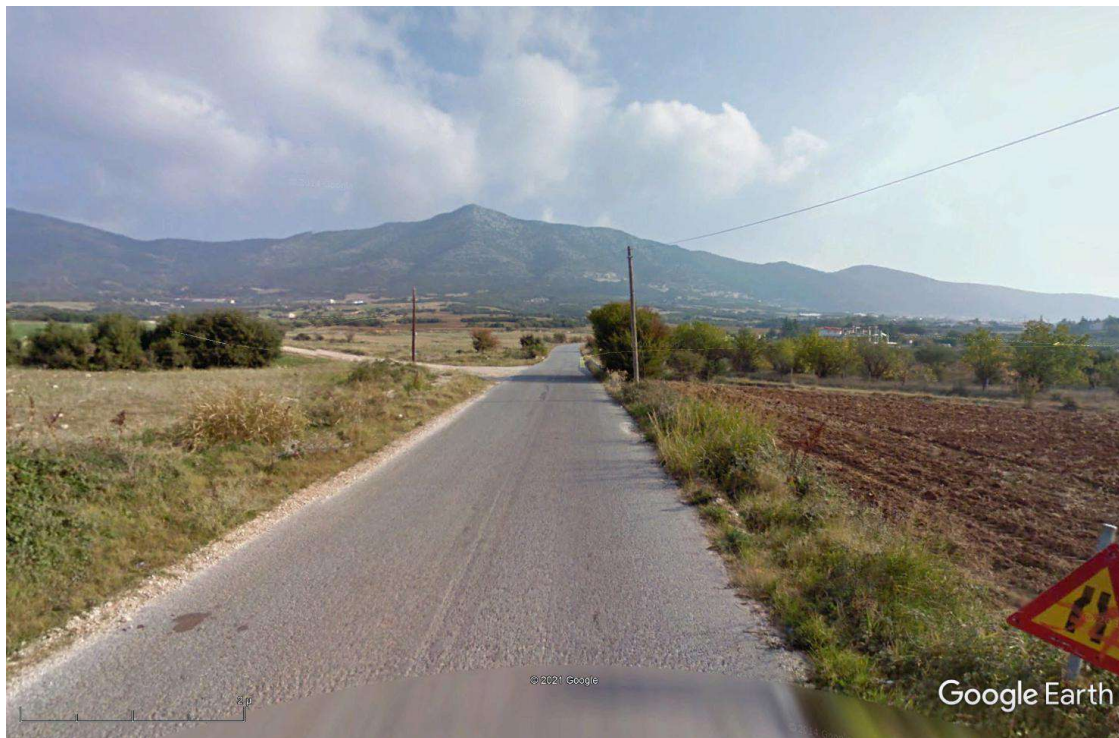
Φωτ.2 Υφιστάμενη κατάσταση κατά μήκος του οδικού τμήματος της δυτικής εισόδου του οικισμού της Γαλάτιστας από την Ε.Ο. Θεσσαλονίκης – Πολυγύρου. Είναι εμφανής η απουσία οδοφωτισμού με τη συνακόλουθη πρόκληση αρκετών προβλημάτων κατά την κίνηση πεζών και οχημάτων.