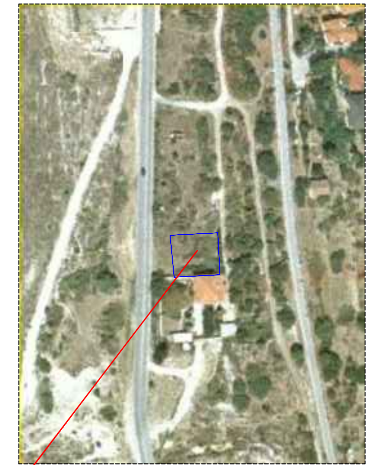
ΘΕΣΗ ΟΙΚΟΠΕΔΟΥ ΠΡΟΣ ΜΙΣΘΩΣΗ

Δήλωση Μηχανικού Δηλώνω υπεύθυνα ότι το παρόν οικοπέδο με (Α,Β,Γ,Δ -Α) που βρίσκεται εντός του αρχικού οικισμού Άρνισσας Δ Έδεσσας Ν Πέλλας, αποτελεί διανομή και έχει εμβαδόν: E(A,B,\Gamma,\Delta -A) = 539.17\tau.μ. Το παραπάνω οικοπέδο είναι ΑΡΤΙΟ και ΟΙΚΟΔΟΜΙΣΤΗΜΟ σύμφωνα με τις ισχύουσες Πολεοδομικές Διατάξεις. Δεν αντικείται στον Ν 651/77 κ δεν υπαχεται στις διατάξεις του Ν 1337/83 Τα όμορα προς αυτό οικοπέδα είναι επίσης ΑΡΤΙΑ και ΟΙΚΟΔΟΜΙΣΤΗΜΑ σύμφωνα με τις ισχύουσες Πολεοδομικές Διατάξεις. Η ΜΗΧΑΝΙΚΟΣ ΕΛΕΝΗ Σ. ΖΑΜΙΝΟΥ ΑΦΡΟΝΙΜΟΣ ΤΟΠΟΓΡΑΦΙΚΟΣ ΜΗΧΑΝΙΚΟΣ ΕΘΝ. ΜΕΤΡΗΣΕΩΝ ΠΕΛΟΠΟΝΝΗΣΟΥ - ΕΛΛΑΣ ΤΗΛ: 27810 22221 - 2788821 Α.Φ.Μ. 048211024 - Α.Π.Δ. ΕΔΕΣΣΑΣ