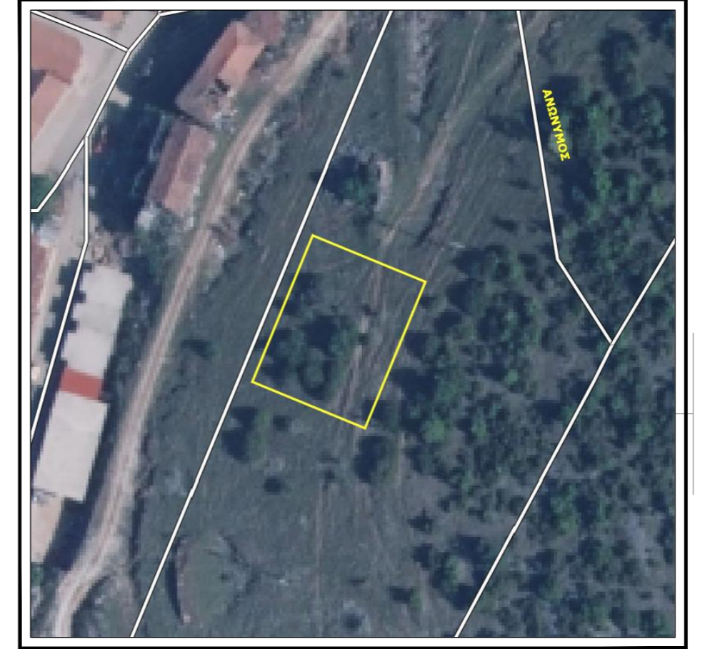
Απόσπασμα ορθοφωτοχάρτη

ΠΑΡΑΤΗΡΗΣΕΙΣ: 1) Το διάγραμμα είναι ενταγμένο στο κρατικό σύστημα συντεταγμένων ΕΓΣΑ 87 2) Οι διαστάσεις και το εμβαδόν υπολογίστηκαν αναλυτικά από τις συντεταγμένες των κορυφών 3) Η εξάρτηση από το ΕΓΣΑ 87 πραγματοποιήθηκε με σύστημα GPS και κάνοντας χρήση του Ελληνικού συστήματος εντοπισμού - HEPOS