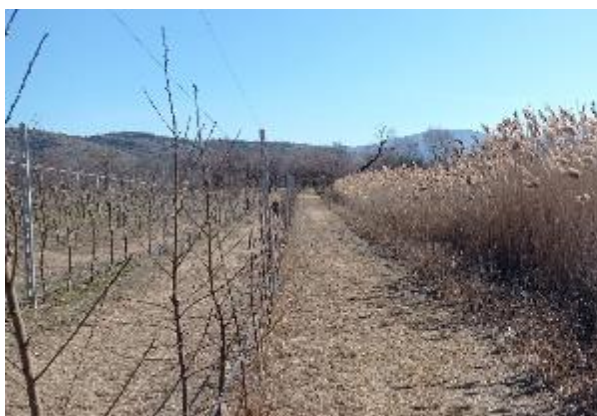
Φωτογραφία 3: Νότια όψη έκτασης 5.988 m 2 προς λίμνη ύπαρξη λωρίδας πλάτους 5 m