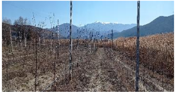
Φωτογραφία 6: Έκταση 6.963,43 m 2 με δέντρα ηλικίας 5 ετών νότια και ανατολική όψη ανάπτυξη καλαμιών

Από τους κτηματολογικούς πίνακες προσωρινής διανομής αγροτεμαχίων επί των αποκαλυφθεισών εκτάσεων, έτους 1989, προκύπτει ότι οι ανωτέρω εκτάσεις δεν περιλαμβάνονται στην προσωρινή διανομή, παρότι βρίσκονται εντός των ορίων του ΑΒΚ 1473 και η χρήση τους είναι γεωργική. Η νομιμότητα κατοχής τους από την κ Μπόγια Ελένη του Σωτηρίου τελεί εν αμφιβόλω, καθώς τις καλλιεργεί ενώ ουδέποτε της είχαν παραχωρηθεί. Επίσης, η αίτησή της για εξαγορά εκτάσεων εμβαδού 3.567,55 m 2 και 6.432,30 m 2 , δεν εξετάστηκε από την αρμόδια επιτροπή απαλλοτριώσεων, λόγω του ότι το άρ. 23 του Ν 4061/2012 κρίθηκε από το ΣΤΕ αντισυνταγματικό. Επισημαίνεται ότι το ίδιο ισχύει για το σύνολο των παραχωρηθεισών παραλίμνιων αποκαλυφθεισών καλλιεργούμενων εκτάσεων, καθόσον ούτε τίτλοι ιδιοκτησίας έχουν δοθεί ούτε έχουν εξεταστεί οι αιτήσεις εξαγοράς, όπως προαναφέρθηκε, με αποτέλεσμα να θεωρούνται καταπατημένες.