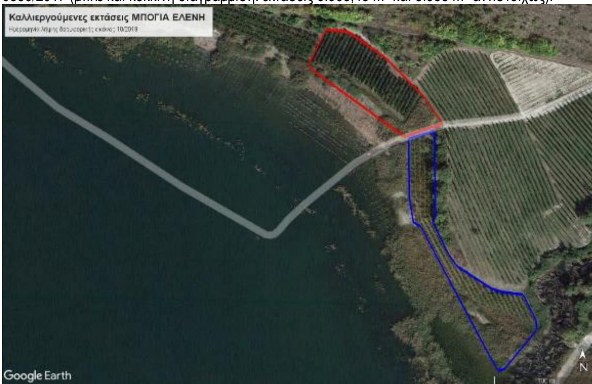
Εικόνα 3: Δορυφορική εικόνα Google Earth καλλιεργούμενων εκτάσεων σε υπόβαθρο χρονολογικής απεικόνισης υποβάθρου 10ου/2019 (μπλε και κόκκινη διαγράμμιση: εκτάσεις 6.963,43 m 2 και 5.988 m 2 αντιστοίχως)