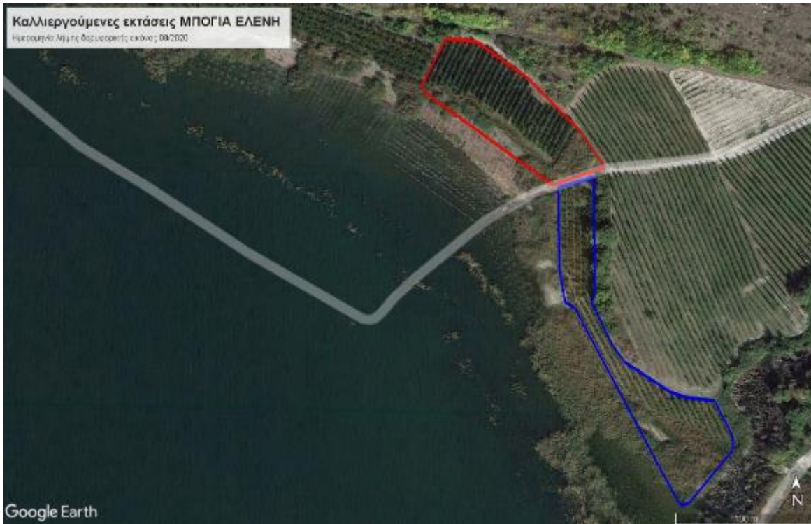
Εικόνα 4: Δορυφορική εικόνα Google Earth σημερινών καλλιεργούμενων εκτάσεων σε υπόβαθρο χρονολογικής απεικόνισης 08ου/2020 (μπλε και κόκκινη διαγράμμιση: εκτάσεις 6.963,43 m 2 και 5.988 m 2 αντιστοίχως)

Κατά την αυτοψία διαπιστώθηκε ότι οι εν λόγω εκτάσεις εντάσσονται σε μια ευρύτερη καλλιεργούμενη περιοχή Β και ΒΑ της λίμνης. Βρίσκονται αντικριστά και χωρίζονται από την αγροτική οδό που καταλήγει στη λίμνη όπως απεικονίζεται και στις παραπάνω εικόνες.