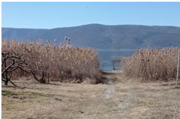
Φωτογραφία 1: Καλαμιώνας μεταξύ των δενδροκαλλιιεργειών και της λίμνης (όψη από την αγροτική οδό προς τη λίμνη)

Σημειώνεται ότι κατά την αυτοψία στις εν λόγω εκτάσεις, καθώς και στη γύρω περιοχή δεν εντοπίστηκαν απόβλητα κενών συσκευασιών φυτοπροστατευτικών προϊόντων ή λιπασμάτων ούτε άλλου είδους απόβλητα.