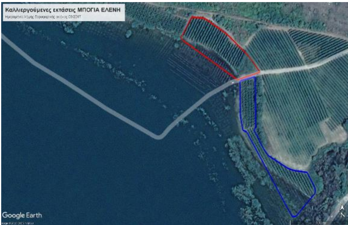
Εικόνα 2: Δορυφορική εικόνα Google Earth καλλιεργούμενων εκτάσεων σε υπόβαθρο χρονολογικής απεικόνισης 08ου/2017 (μπλε και κόκκινη διαγράμμιση: εκτάσεις 6.963,43 m 2 και 5.988 m 2 αντιστοίχως).