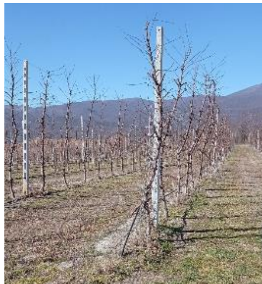
Φωτογραφία 2: Όψη έκτασης 5.988 m 2 από την αγροτική οδό