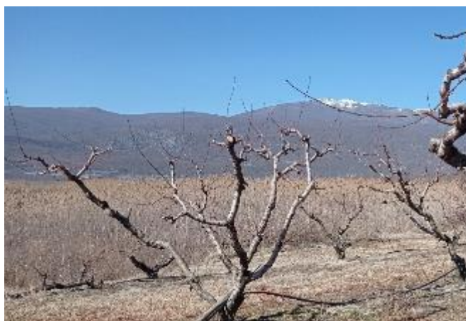
Φωτογραφία 4: Έκταση 6.963,43 m 2 με παραγωγικά δέντρα ηλικίας 25 ετών κατά δήλωση και ανάπτυξη καλαμιώνα προς τη λίμνη (νότια όψη).