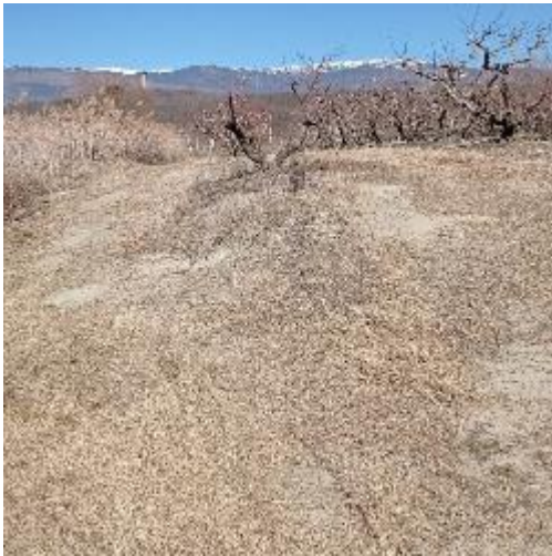
Φωτογραφία 5: Έκταση 6.963,43 m 2 διάδρομος μεταξύ καλλιέργειας και καλαμιών