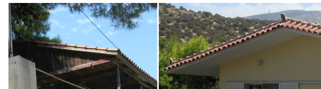
Αντιπαράθεση κεραμικών στεγών. Αριστερά στέγη με ξύλινο υπόβαθρο, εύφλεκτη. Δεξιά, τσιμεντένια, δεν αναφλέγεται. Και στις δύο περιπτώσεις η βλάστηση ακουμπά στις στέγες, γεγονός που αυξάνει τον κίνδυνο από πυρκαγιά.

Μεταλλικά στοιχεία (σίδερο, αλουμίνιο) δεν αναφλέγονται και δεν μεταδίδουν τη φωτιά. Όμως, μία κατασκευή με μεταλλικό σκελετό, αν εκτεθεί σε υψηλές θερμοκρασίες μπορεί να καταρρεύσει χωρίς προειδοποίηση.