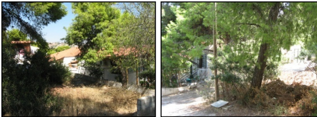
Παραδείγματα σπιτιών που απειλούνται από δασική πυρκαγιά λόγω της βλάστησης, των σκουπιδιών και της συσσωρευμένης νεκρής ύλης σε γειτονικούς χώρους.

Σημαντικό ρόλο για την πιθανότητα μιας κατοικίας να γλυτώσει σε περίπτωση πυρκαγιάς παίζουν τα υλικά κατασκευής της, η τοποθεσία και η βλάστηση που υπάρχει γύρω της. Γενικά ισχύει ο κανόνας ότι «μία κατοικία είναι τόσο ευάλωτη όσο το πιο αδύναμο σημείο της». Επίσης είναι σημαντική η δυνατότητα πρόσβασης πυροσβεστικών οχημάτων σε αυτήν, η προετοιμασία της κατοικίας και του περιβάλλοντος χώρου από τους ιδιοκτήτες αλλά και οι ενέργειές τους πριν και κατά την άφιξη της πυρκαγιάς.