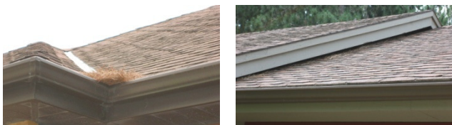
Αριστερά, συσσώρευση πευκοβελόνων στην υδρορροή. Δεξιά, σχετικά καθαρή στέγη.

Καθαρίζουμε τη στέγη μας από ξερές βελόνες και φύλλα, καθώς και όσες άλλες επιφάνειες του σπιτιού μπορεί να έχουν μαζέψει νεκρή φυτική ύλη (π.χ. υδρορροές).